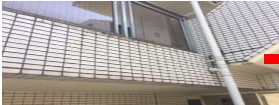
外壁タイルの洗浄施工の様子